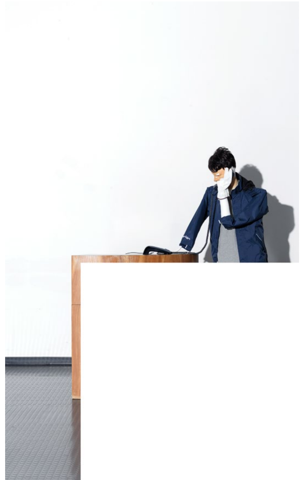
Eingang Schule, Detail #3