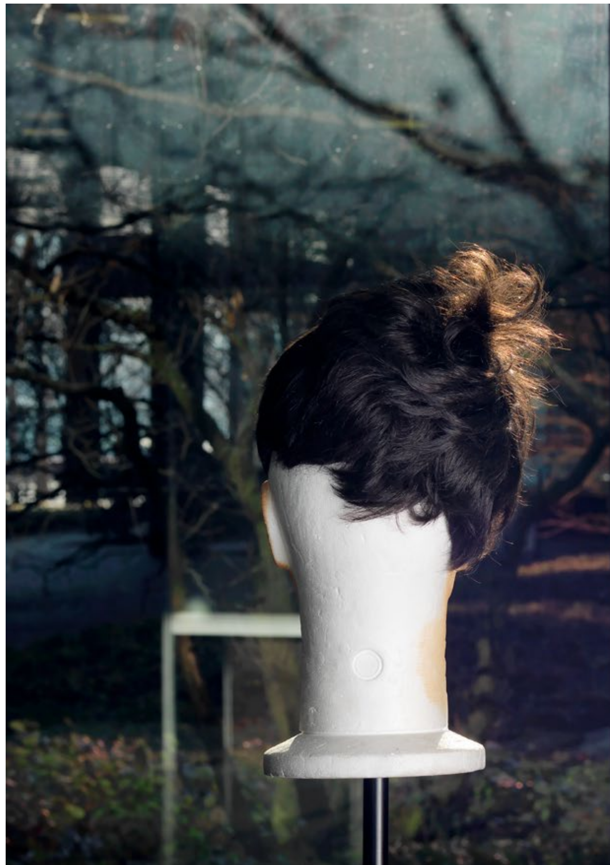
Eingang Internat, Detail #2