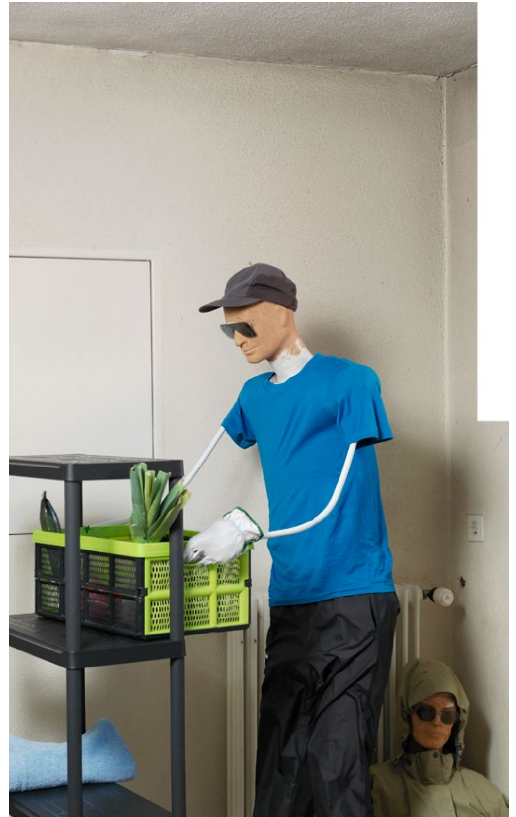
Eingang Internat, Detail #1