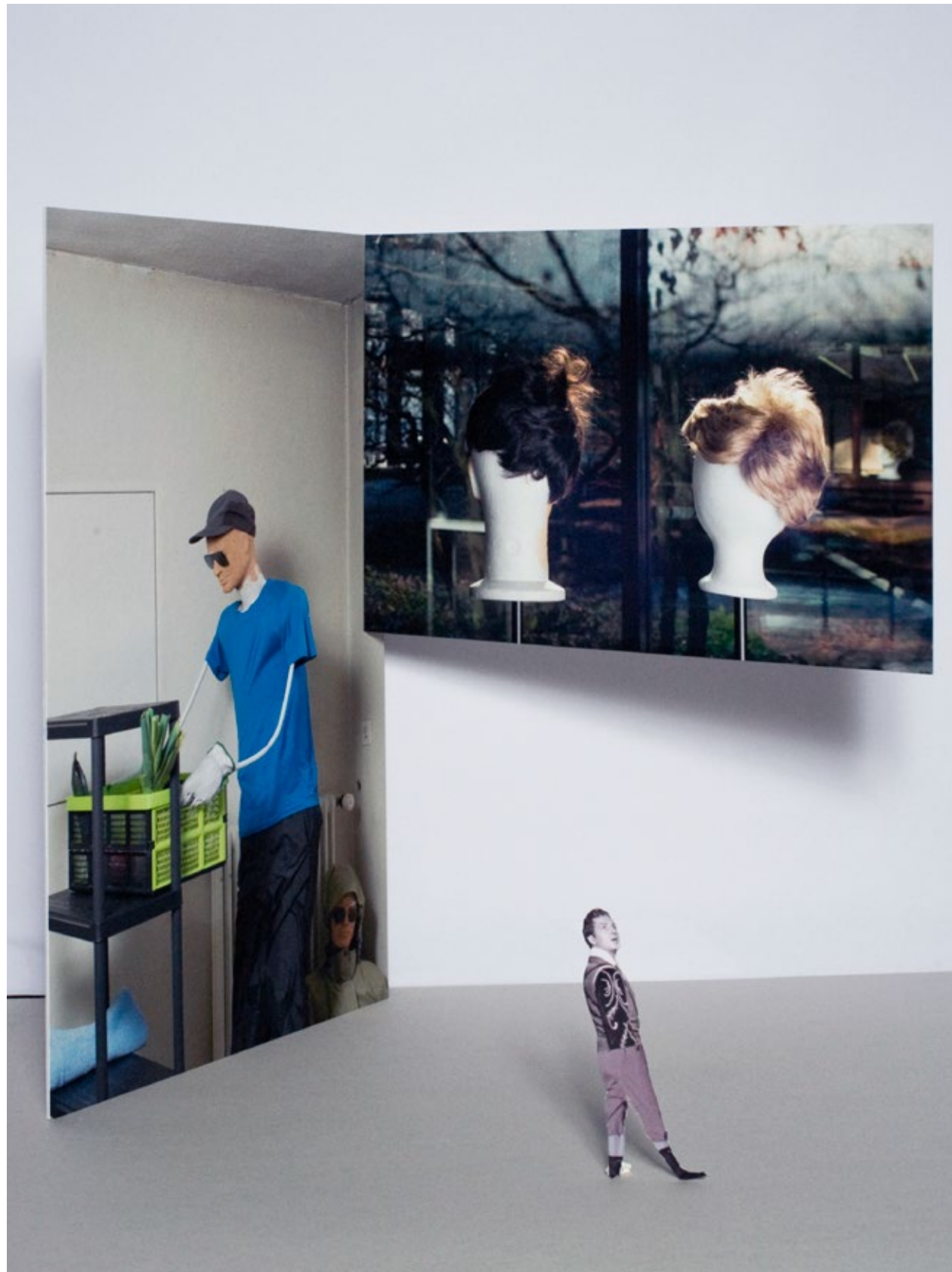
Eingang Internat, Modell Wand Links, Wand Mitte