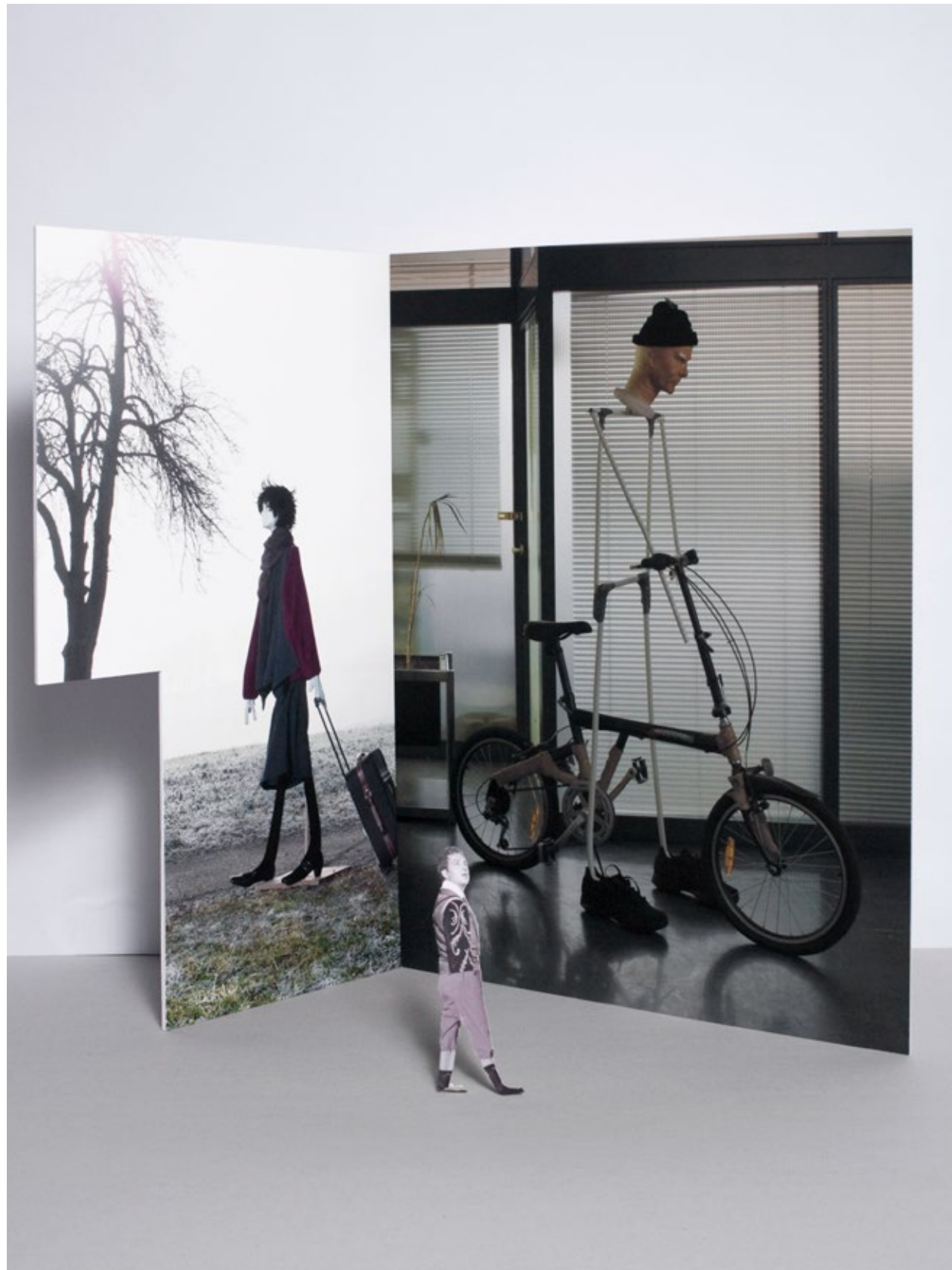
Eingang Schule, Modell Wand Links, Wand Mitte