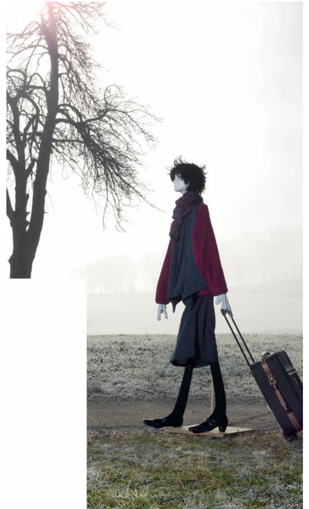
Eingang Schule, Detail #1