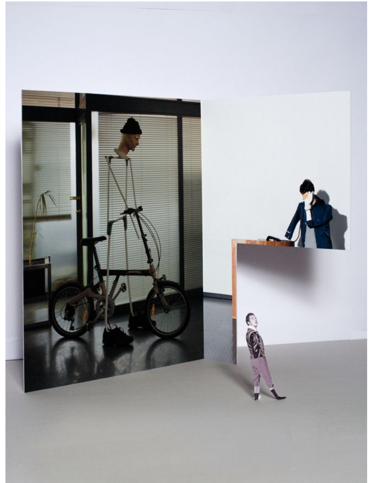
Eingang Schule, Modell Wand Mitte, Wand Rechts