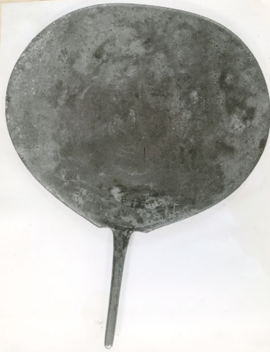
Spiegel (Sammlung A. Ghertsov). P. KAPLONY, Denkmäler der Prinzessin Neferu2 und der Königin Ti-menêse.