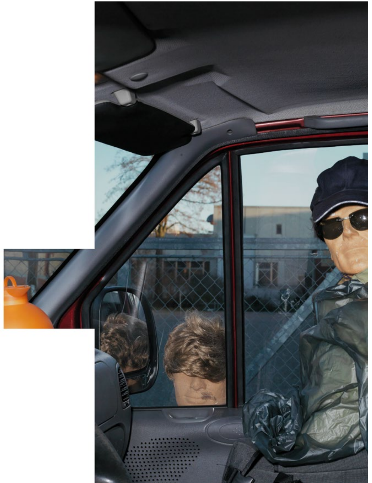
Eingang Internat, Detail #3