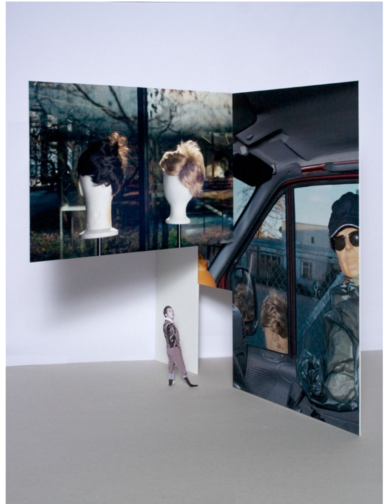
Eingang Internat, Modell Wand Mitte, Wand Rechts