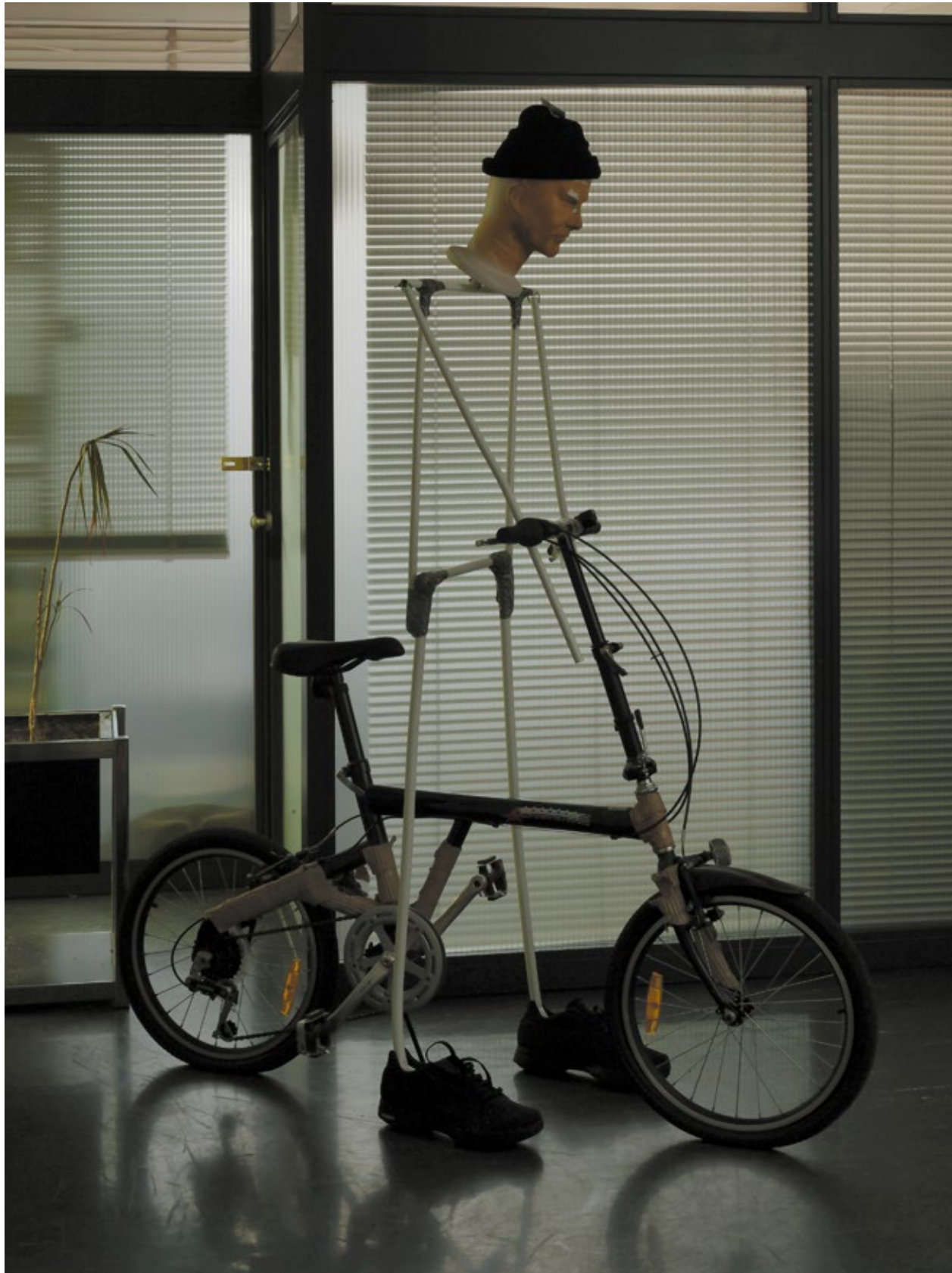
Eingang Schule, Detail #2